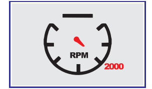
2000 आर पी एम - अधिक टार्क, इंजन की कम धिसावट