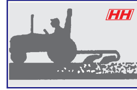
स्वचलित डैपथ व ड्राफ्ट कंट्रोल लाईव हॉड्रालिक्स मिक्स मोड के साथ