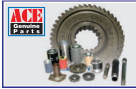
ACE किफायती जैनुअन पार्ट्स ACE किफायती जैनुअन ऑयल