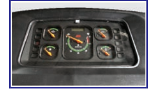
आकर्षक मीटर कंसोल