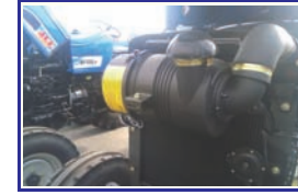
ड्राई टाईप एयर क्लीनर