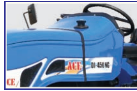
फ्यूल टैंक - 55 लीटर