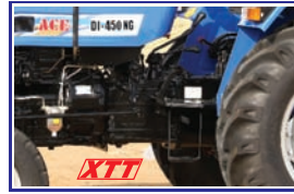
हैवी ड्यूटी XTT ट्रान्समिशन